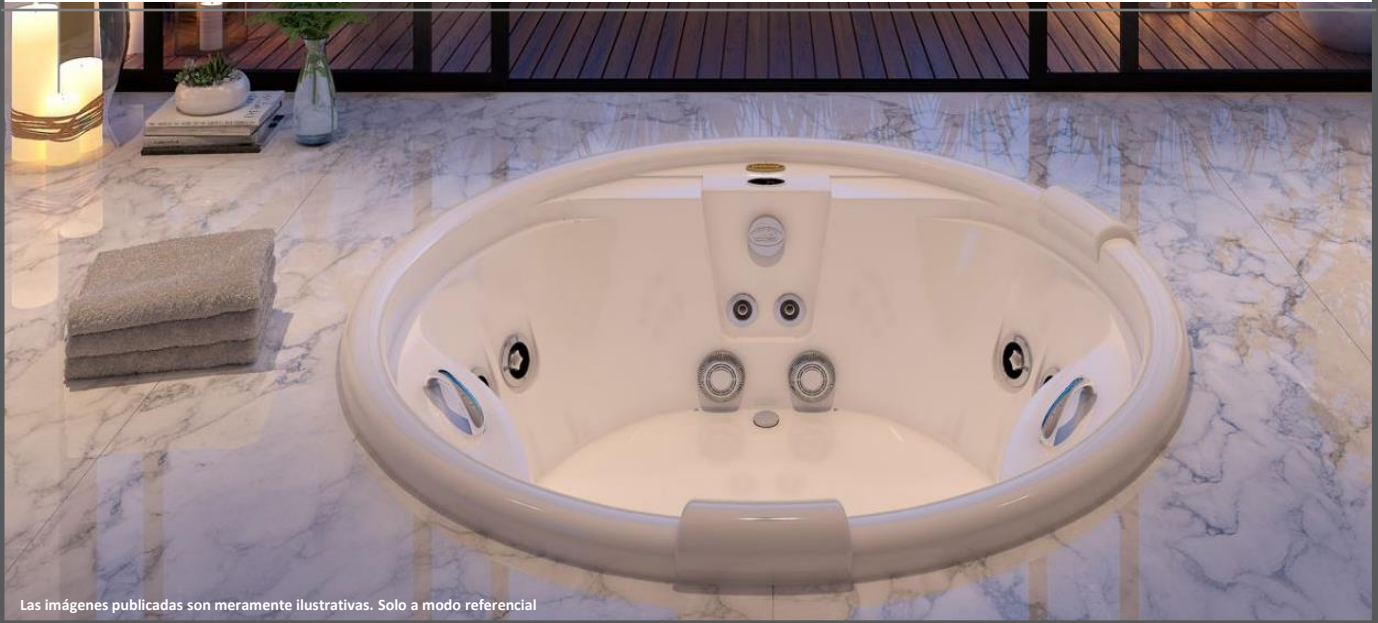
Las imágenes publicadas son meramente ilustrativas. Solo a modo referencial